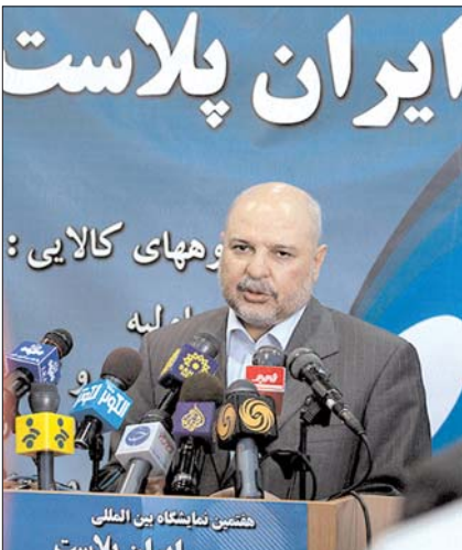
نویدهای وزیر نفت در ایران پلاست هفتم