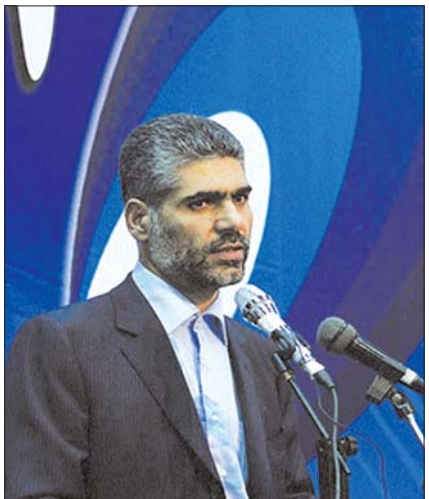
مهندس بیات، بانک صادرات برای رفع موانع مالی پتروشیمی با پیش گذاشت